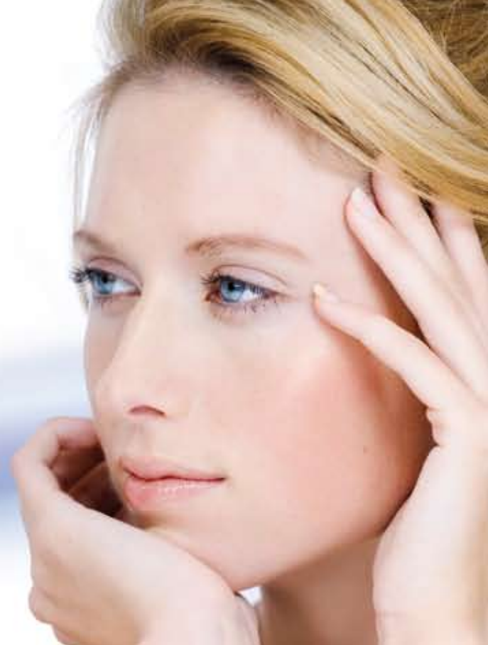
Visible wrinkles smoothing already after the second week of That's Pure Skin products treatment