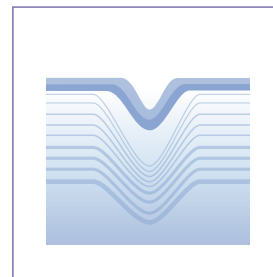
Hautoberfläche mit Falten